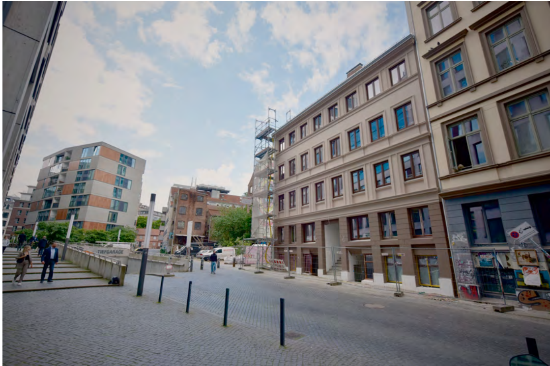
Blick in die Speckstraße von der Caffermacherreihe