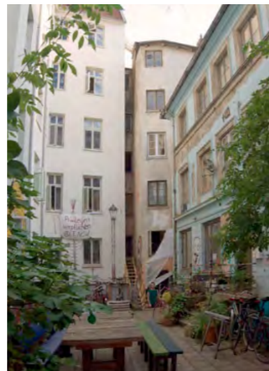
Speckstraße vom Kutscherhof